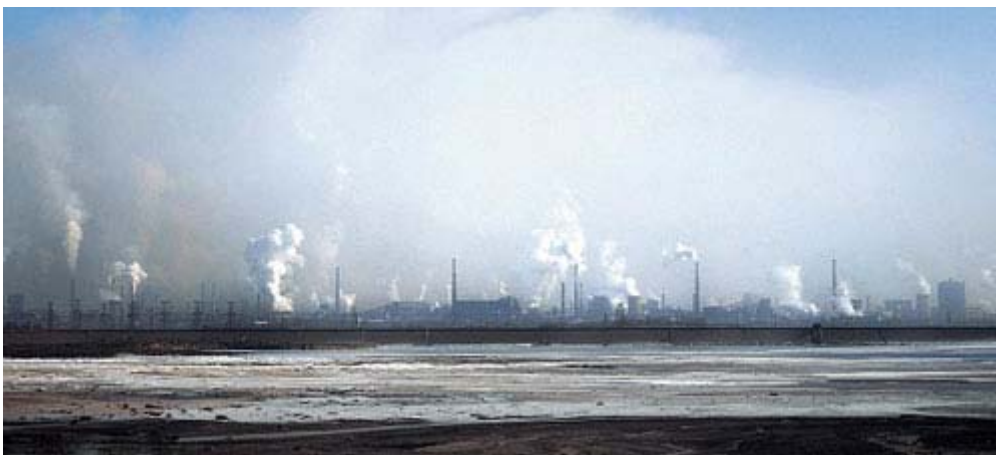
De neodymiumindustrie bij Baotou

Dit is de dodelijke en sinistere kant van de windmolenfabrikanten waar een mens liever niet aan herinnerd wil worden.