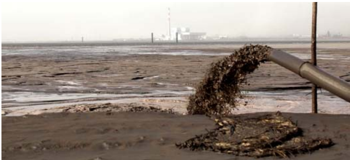
Uit tientallen van dit soort afvoerbuizen stroomt het gif het meer in