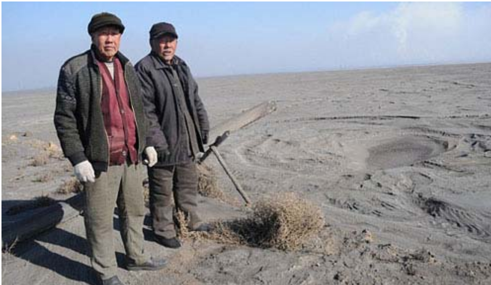
Twee inwoners aan de rand van het 8 kilometer brede en 15 kilometer lange meer

Deze stinkende en misselijk makende smurrie is het resultaat van een industrieel proces dat ervoor moet zorgen dat in Nederland en omliggende landen de windmolens draaien.