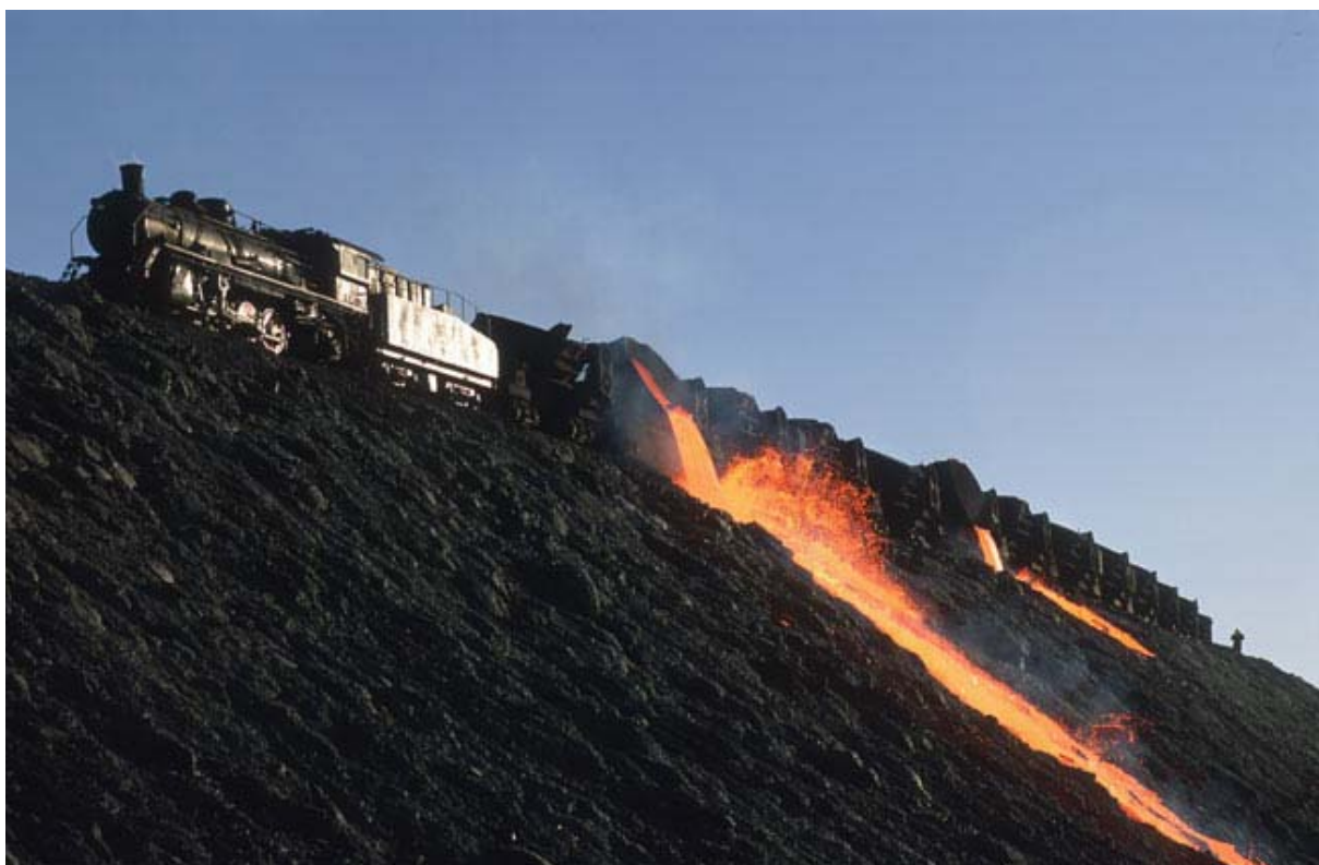
Treinladingen vol met giftige slakken storten het gif om dijken van te maken