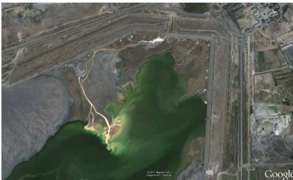
Noordelijke detailopname van het gifmeer bij Baotou. Duidelijk zijn de tientallen lozingspijpen te zien die per dag meer dan 100.000 liter zwaar verontreinigde grond met giftige vloeistoffen in het meer lozen.