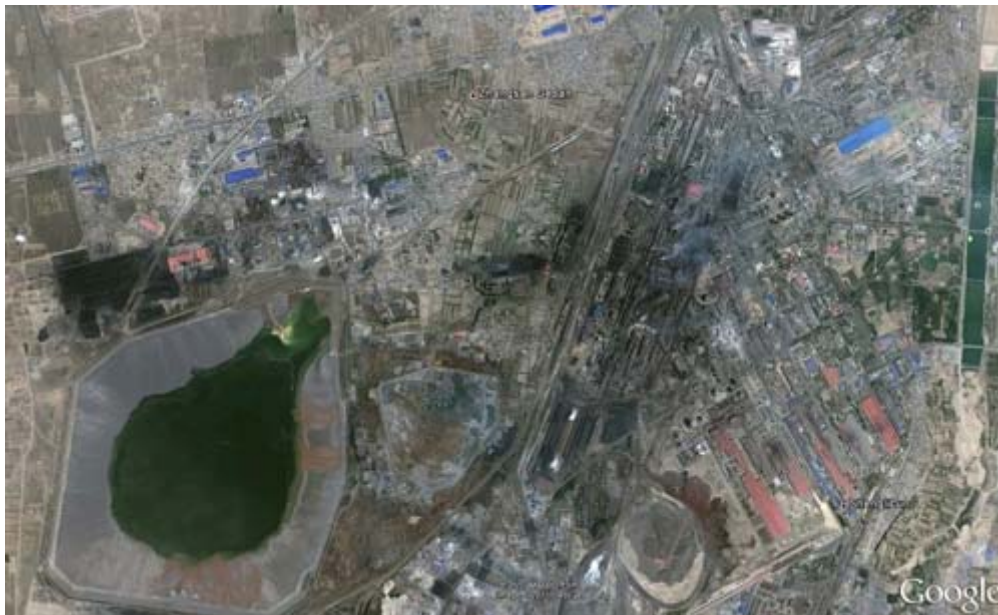
Het gifmeer (links) bij Baotou. De neodymium fabrieken (de zwarte plekken) en de plaats Baotou (rechts)

Verborgen en ver uit het zicht achter in rook gehulde fabrieken in Baotou en bewaakt door pelotons bewakers, ligt een 8 kilometer breed en 15 kilometer lang meer, omgeven door een tientallen meters hoge dijk. De landbouwgrond bestaat niet meer, duizenden inwoners van Baotou zijn ziek en het meer vormt een groot gevaar voor de drinkwatervoorziening van miljoenen mensen in de rest van China omdat het giftig water uit het meer zich langzaam vermengt met water van één van de belangrijkste waterwegen van China, de Gele Rivier.